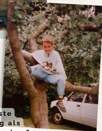
"Seine liebste Beschäftigung als Teenager war zocken"