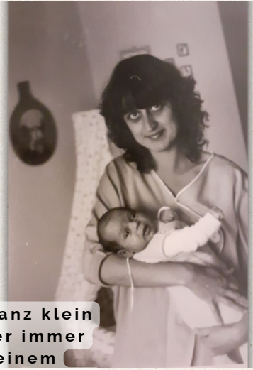
"Als er ganz klein war ist er immer mit seinem Plüschnashorn ins Bett gegangen"