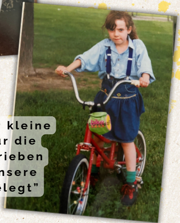
"Elly hat immer kleine Zettelchen für die Familie geschrieben und sie auf unsere Kopfkissen gelegt"