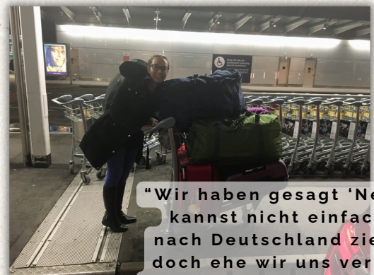
"Wir haben gesagt 'Nein, du kannst nicht einfach so nach Deutschland ziehen', doch ehe wir uns versahen waren wir auf dem Weg zum Flughafen"