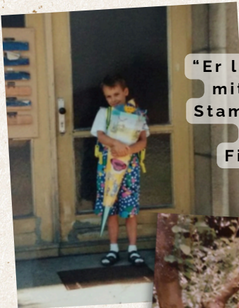
"Er liebte Eierkuchen mit Apfelmus und Stampfkartoffeln mit Erbsen und Fischstäbchen"